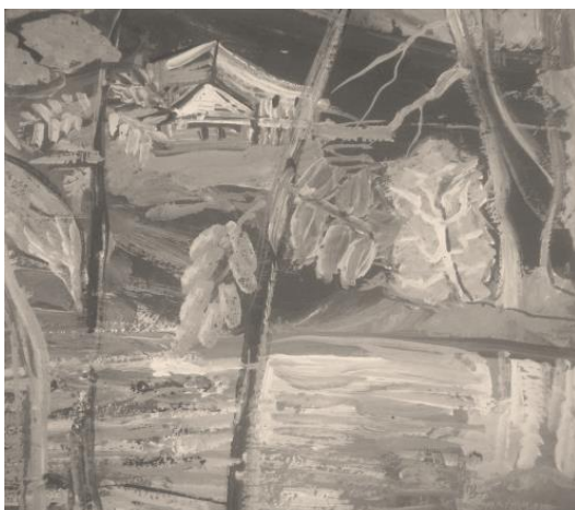
Légrer Imre 7. osztály